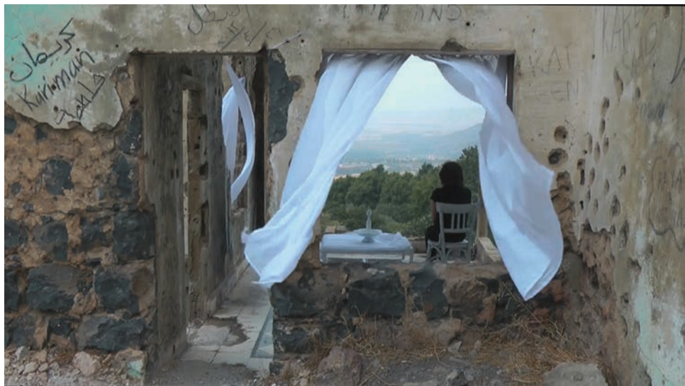
Randa Maddah Light Horizon , 2012 Vidéo, 7 min 22 s